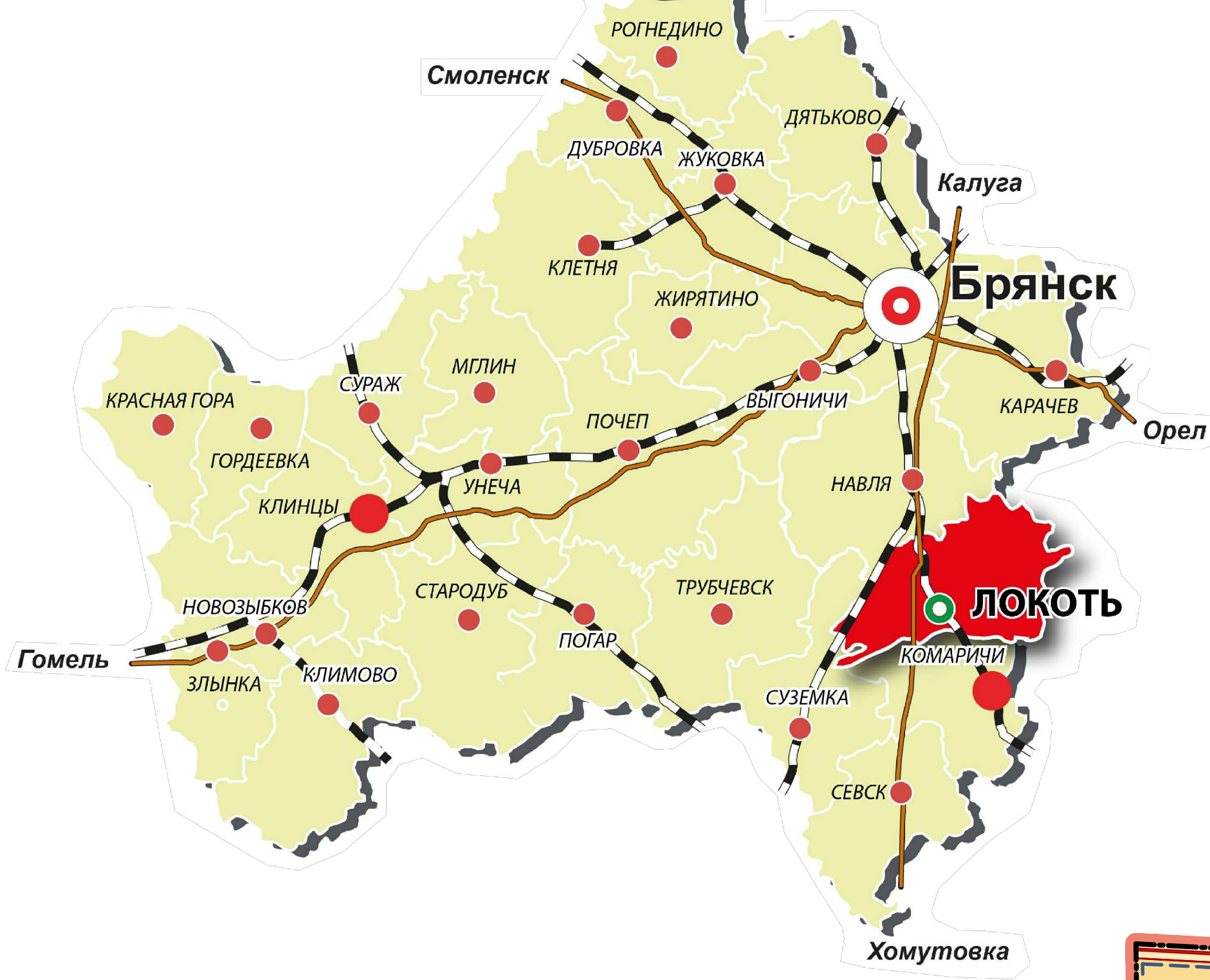
СХЕМА РАСПОЛОЖЕНИЯ ЛОКОТСКОГО ГОРОДСКОГО ПОСЕЛЕНИЯ НА ТЕРРИТОРИИ БРАСОВСКОГО РАЙОНА